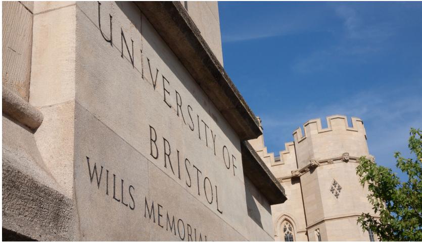
University of Bristol.