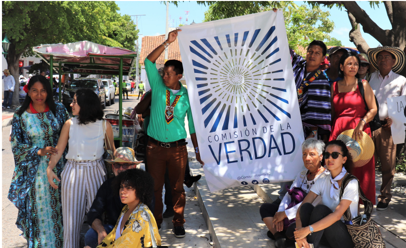
Demostraciones de apoyo a la CV en Cesar, Valledupar, Comisión de la Verdad.

garantizar que la violencia no se repita. El equipo de pedagogía de la CEVCN ha conformado alianzas con noventa universidades de Colombia para crear grupos de voluntarios, siendo mil voluntarios la meta en 2020. Organizaciones de la sociedad civil, incluyendo a Rodeemos el Diálogo (ReD), se han reunido con el equipo de pedagogía de la CEVCN para diseñar estrategias pedagógicas en colegios y apoyar el trabajo del equipo con los y las jóvenes.